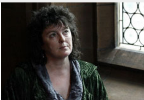
Carol Ann Duffy

La poetessa scozzese CAROL ANN DUFFY, autrice della raccolta ESTASI, pubblicata in Italia dalla Del Vecchio Editore, è stata insignita del prestigioso titolo di Poeta Ufficiale del Regno Unito.